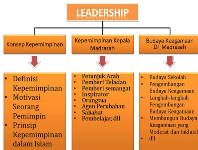
Gambar 2. Peta Konsep Manajemen Pembelajaran Leadership di Madrasah

Dalam konteks ini, pembelajaran leadership dapat dilakukan dengan tanpa kekerasan atau dalam istilah tulisan ini “nirkekerasan”. Hal ini juga berarti bahasa hukuman fisik yang biasa dilakukan dalam pembelajaran leadership di madrasah berdalih “disiplin” dapat ditinggalkan. Sebagai gantinya, dilakukan program-program pembelajaran leadership yang mendidik. Tanpa kekerasanpun, pembelajaran leadership dapat optimal dilakukan, manakala program tersebut sudah menjadi budaya keagamaan di madrasah (seperti gambar 2 di atas).